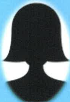
Magalie DESERT GS-CP